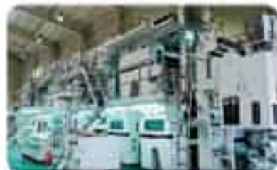
200여종 신문제작 대행

서울시 부일로 815번길 56-67 (문수동) Tel. 02) 2684-3377