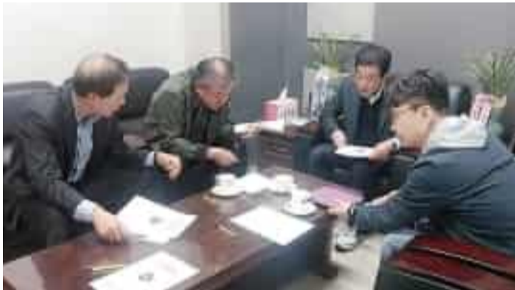
한·일 합동세미나 추진위원회가 행사의 성공적인 개최를 위해 회의를 진행하고 있다.