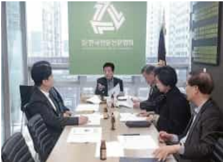
이사회에 참석한 임원진이 한·일 합동세미나 개최에 관한 의견을 나누고 있다.