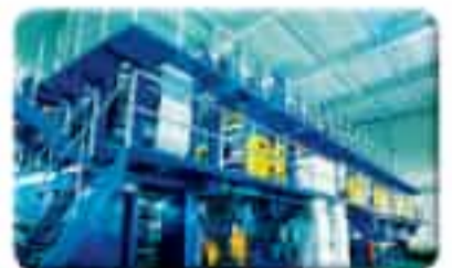
34년 전통 인쇄 기술력