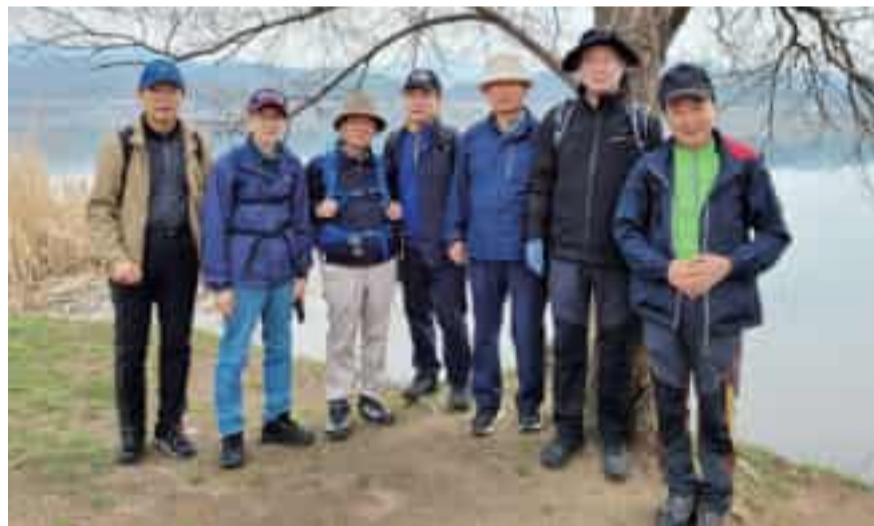
이번달 열린 '전문신문인 건강걷기'에 함께한 회원들이 트레킹 후 기념촬영을 하고 있다.